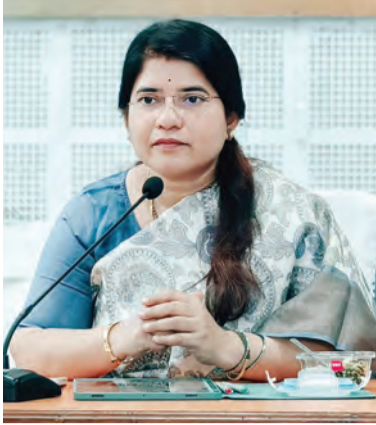
పదిల వేయకండా పూర్తి స్థాయిలో పరిస్కారం అయ్యి వరకు ఫాలో అప్ చర్యలు చేపట్టాలని కలెక్టరు స్పష్టం చేశారు.

కేవలము 34దశాస్సులు మత్రమే పరిస్కారమైన నేపథ్యములో మిగిలిన 544 పిర్యాదులను అధికారితన పరిస్కారించేందుకు అధికారులు బాధ్యతాయతముగా వ్యవహరించాలని సూచించారు. పింపనలకు సంబంధించి 181 రెవెన్యూశాఖకు 106 సర్వే విభాగానికి 93 మున్సుపల్ అడ్మినిస్ట్రేషన్ 66 పంచాయతీరాజ్ కు 30 పోలీస్ శాఖకు 10 వ్యవసాయానికి 10 అరేబియన్ 9 జలవనరుల శాఖకు 9, హాస్పింగుకు 7 సూర్యులు 7 తదితర శాఖలకు పరిధిలో నీటి సరఫరా 578 పిర్యాదులు వచ్చినట్లు కలెక్టరు తెలిపారు. ప్రతి పిర్యాదును అధికారులు వ్యక్తిగతంగా పరిశీలించి పిటిషన్లను స్వయంగా పరిధిలో పెందింగులో ఉన్న సమస్యలపై నిరంతర చర్యలు కొనసాగించాలని కేవలము స్పందించి