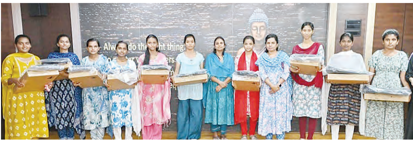
: బేటీ బచావ్ - బేటీ పఠావ్ పథకంలో ల్యాప్ టాప్లను పంపిణీ చేసిన కర్నూలు, మే 19, ప్రభాకర్ వార్త

నిర్వహించిన కార్యక్రమంలో బేటీ బచావ్ - బేటీ పఠావ్ పథకంలో భాగంగా 20 24 25 విద్యార్థి సంవత్సరంలో వదో తరగతిలో ప్రతిభ కనబరిచిన పేద వర్గాలకు చెందిన 12 మంది బాలికలకు జిల్లా కలెక్టర్ ల్యాప్ టాప్లను పంపిణీ చేశారు. ఈ సందర్భంగా కలెక్టర్ మాట్లాడుతూ బాలికల విద్యాభ్యాసాన్ని ప్రభుత్వ ప్రాధాన్యత ఇస్తోందన్నారు. ఆర్థిక ఇబ్బందులు ఎదురైనా